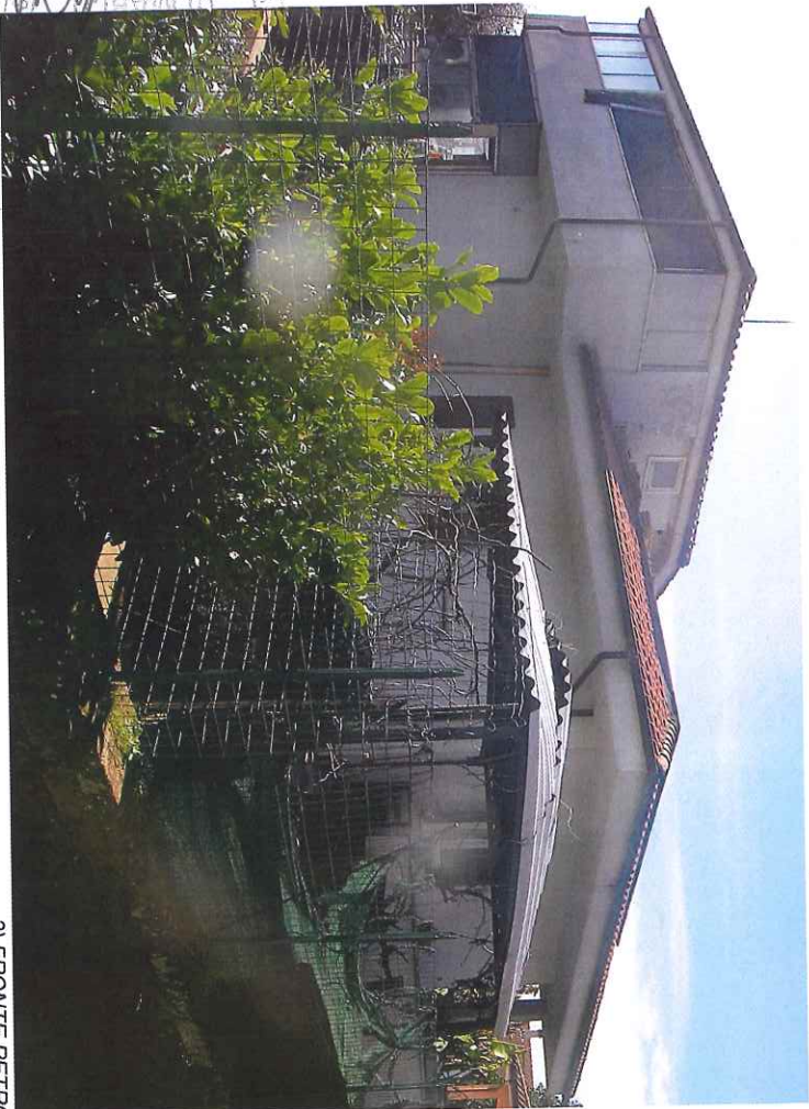
3) FRONTE RETRO