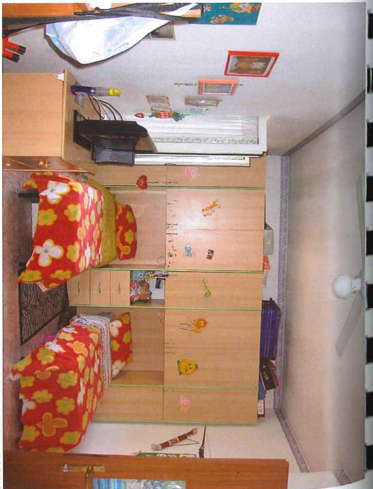
11) CAMERA DA LETTO DOPPIA