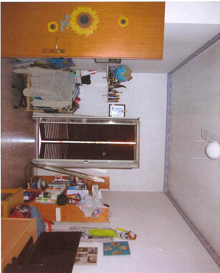
14) CAMERA DA LETTO DOPPIA