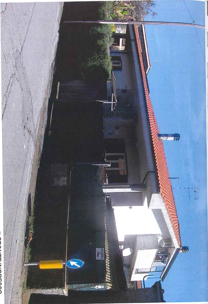
1) FRONTE INGRESSO