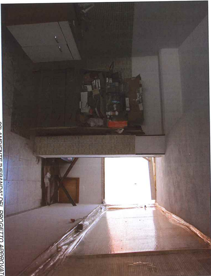
22) AMBIENTE "VERANDA" DEL PROGETTO APPROVATO