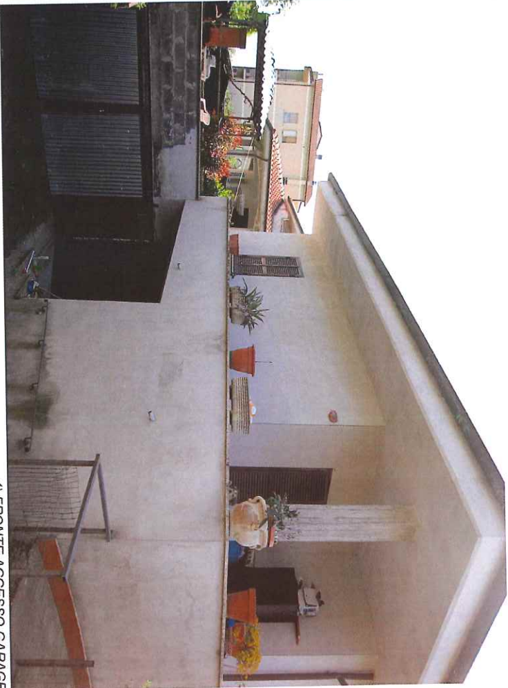
4) FRONTE ACCESSO GARAGE