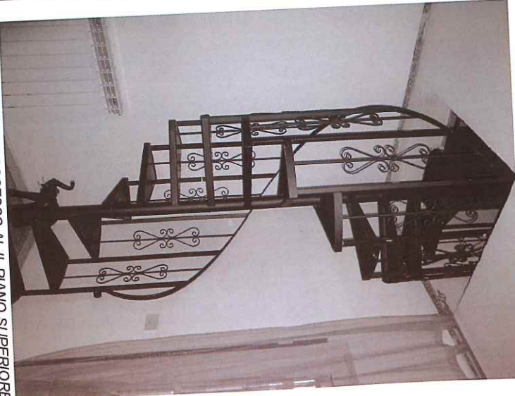
9) SCALA DI ACCESSO AL PIANO SUPERIORE

DI MARCO N. 4 Soc. Agr. CANTIERI & COSTRUZIONI