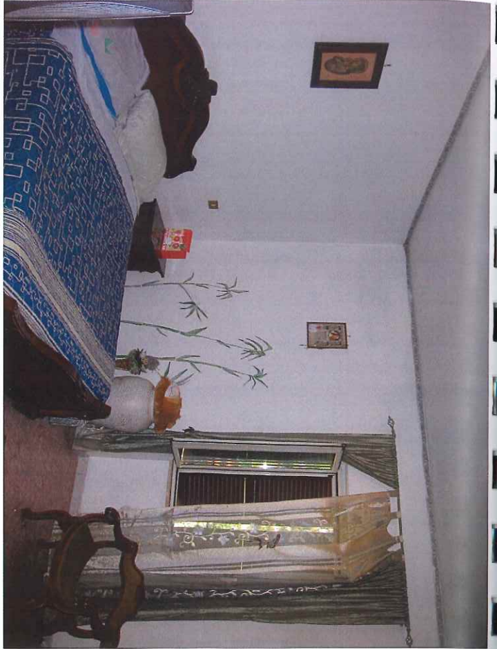
10) CAMERA DA LETTO MATRIMONIALE